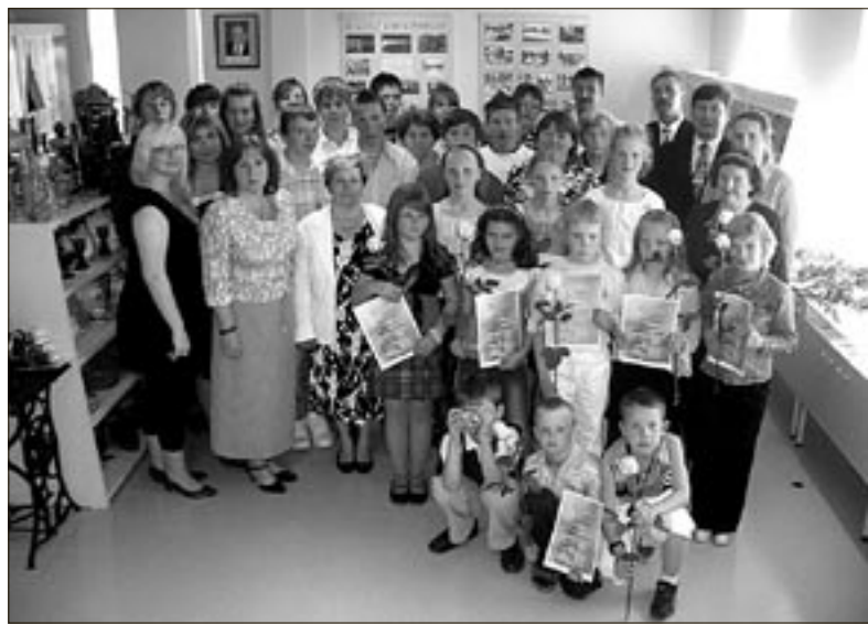
• Mõisaküla Kooli tublimad õpilased ja kooli- ning lasteaiaõpetajad linnajuhtide vastuvõtul.

Õppeaasta jooksul õppetöös ja spordis silma paistnud Mõisaküla Kooli õpilased ja hulk õpetajaid nii koolist kui lasteaiast olid 2. juunil palutud muuseumisaali linnavolikogu esimehe Jorma Oiguse ja linnaapea Ervin Tambergi pidulikule vastuvõtule.