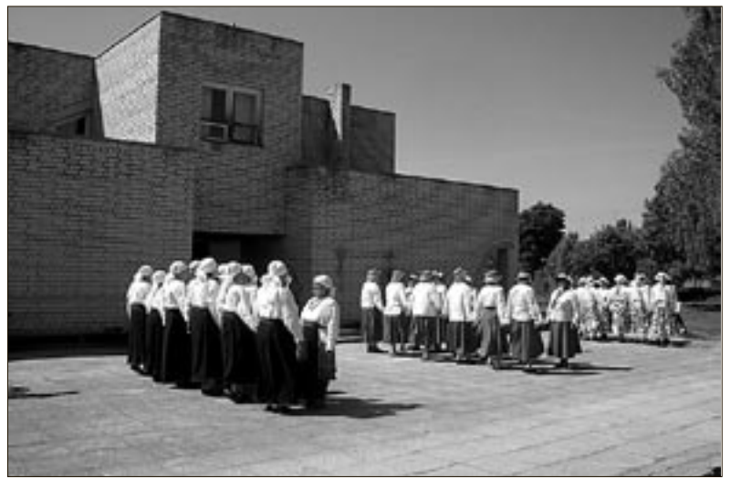
● Halliste (vasakult), Abja ja Mõisaküla memmed kirkais kostüümides ühistantsul memme-taadi suvepäeval Mõisakülas.