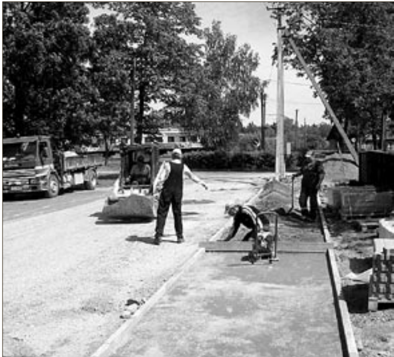
• Kõnnitee-ehitajad mõisakülas Sihveri tänaval.