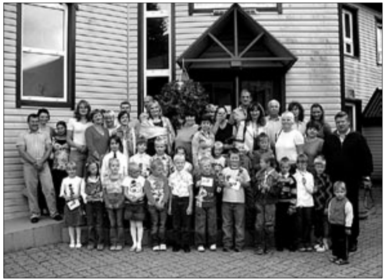
● Abja vallast tänavu kooli astunud lapsed koos vanematega olid kooli eel palutud vallamajja vallavanema vastuvõtule.