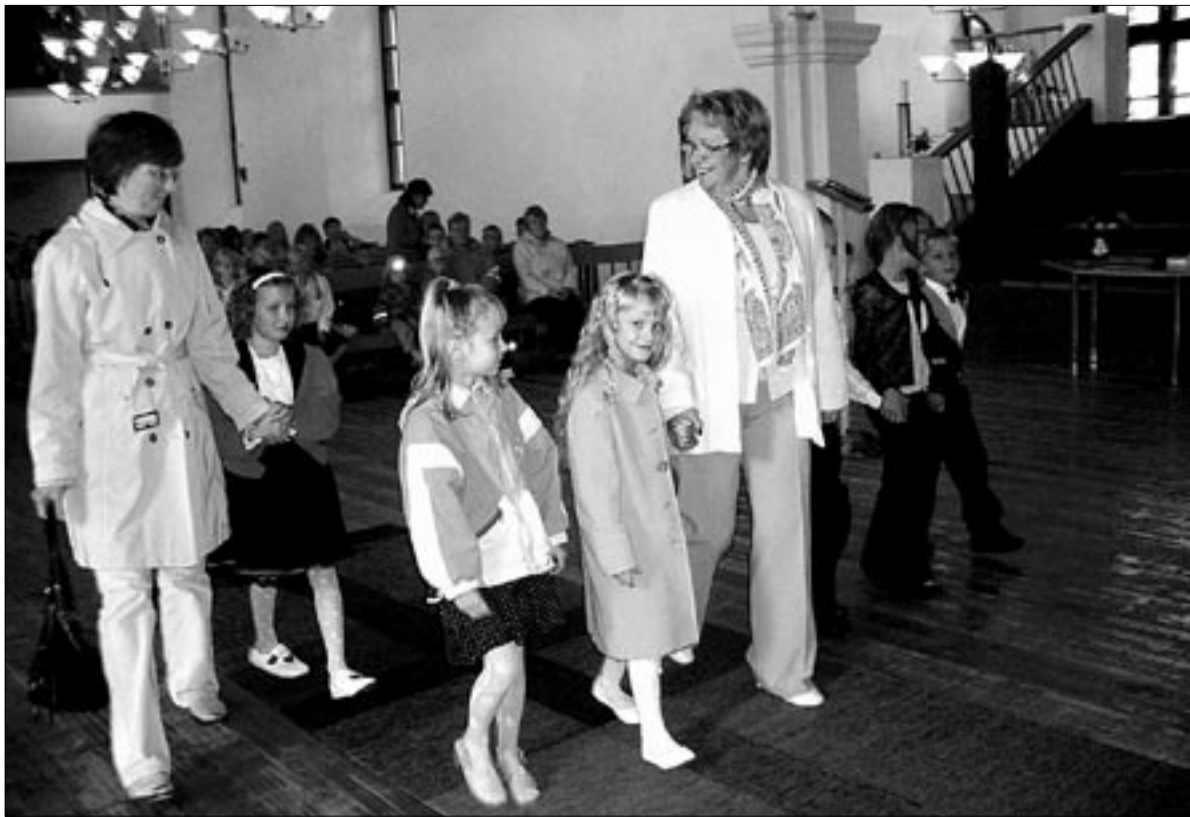
● Oma õpetajate käekõrval läksid Halliste koolijütsid 1. septembril kirikus altari ette õnnistust saama.