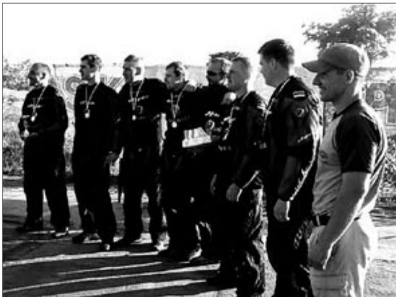
● Võistkond Re-start medalitega.