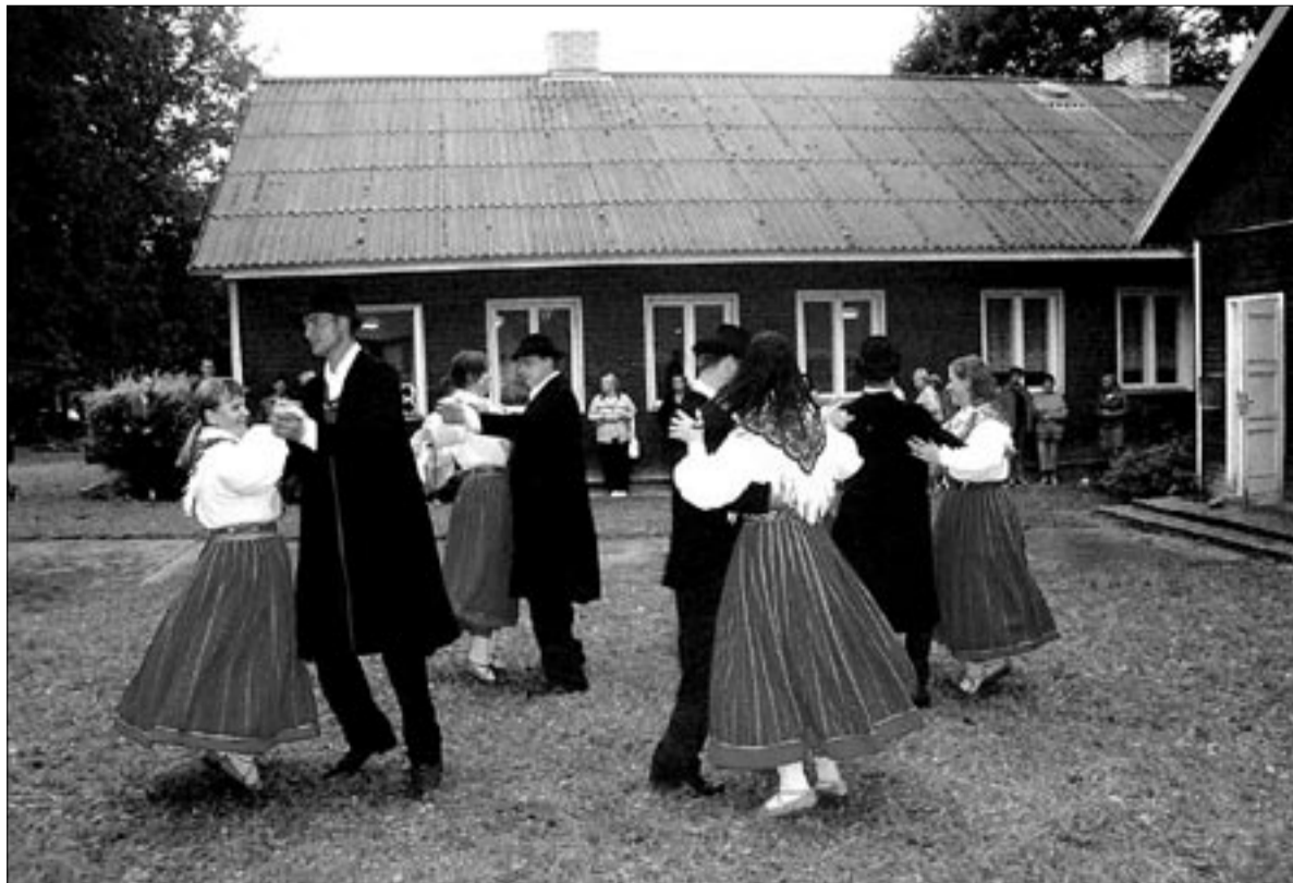
● Penuja külapäevale lisasid meeleolu ja kirevust tantsurühmad Turel (pildil) ja Mamma Mia Halliste vallast.