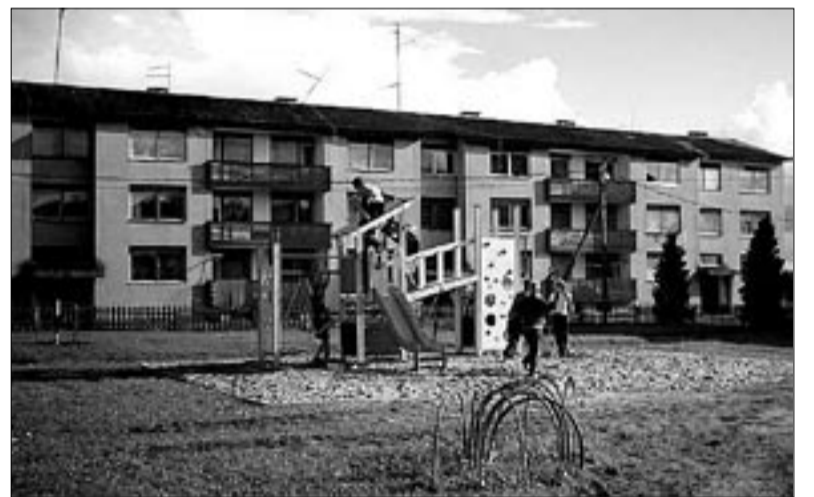
● Õisu lapsed tundsid uuest mänguväljakust mõnu juba enne selle lõplikku valmimist.

Halliste spordiklubi eestvõttel valmis Õisu ja Halliste alevikukeskustes kortermajade juures septembri algupoleel uus laste mänguväljak.