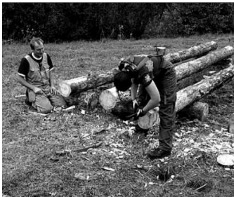
● Küüni taastamise õpipäevadel Paudis oli kirves käes nii meestel kui naistel.