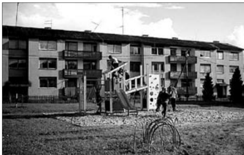
● Õisu lapsed tundsid uuest mänguväljakust mõnu juba enne selle lõplikku valmimist.

Halliste spordiklubi eestvõttel valmis Õisu ja Halliste alevikukeskustes kortermajade juures septembri algupoolel uus laste mänguväljak.