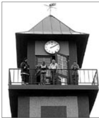
• Kell ülal tornis näitab bussisõitjatele õiget aega, tuulelipp kella kohal aga Abja Tulekaitse Seltsi sünniaastat 1899.

Mehed panid oma puhkuse ja tööst vabad päevad kõik sinna sisse. Töötasime niikaua, kuni pimedaks läks. Tahtsime sel moel anda ka oma poolse pisikesse panuse Eesti Vabariigi ülesehitusse sellal. Muidu meil poleks olnud võimalik täita neid ülesandeid, mida meilt nõutakse elanike turvalisuse tagamiseks.