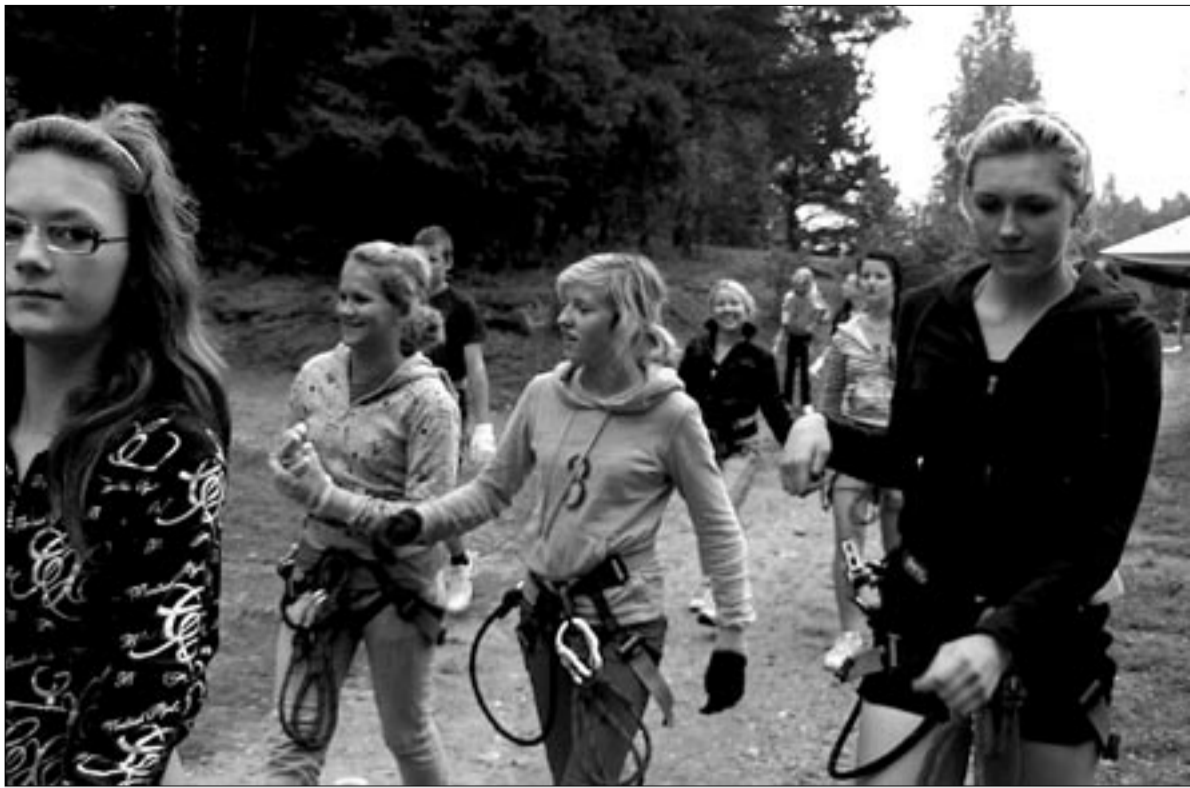
● Täisvarustuses Mõisaküla noored sammumas vastu katsumustele Otepää seikluspargis.