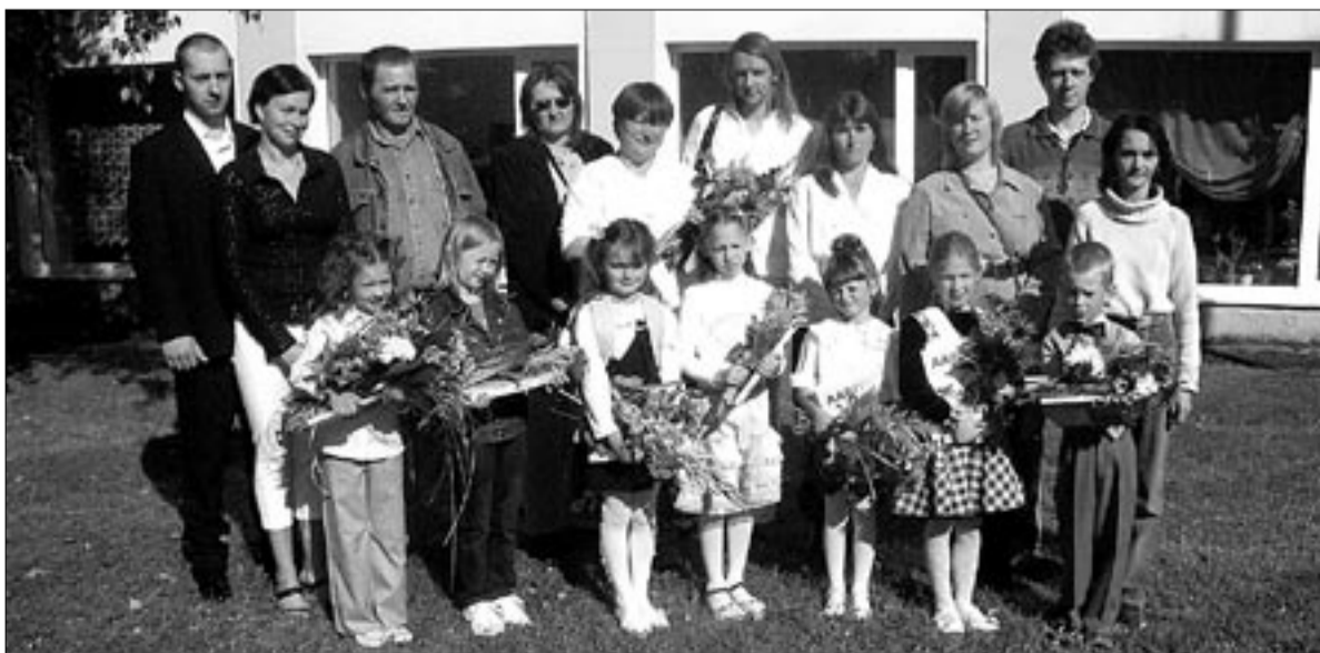
● Mõisaküla Kooli I klass koos õpetaja ja vanematega esimesel koolipäeval.