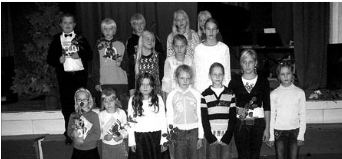
● Abja Muusikakooli I klassi astus sel sügisel 16 õpilast.