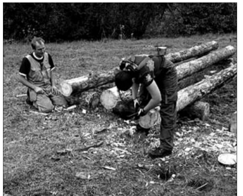
● Küüni taastamise õpipäevadel Paudis oli kirves käes nii meestel kui naistel.