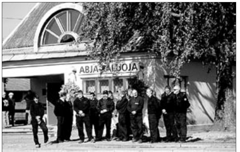
● Abja-Paluoja päästedeepoo uue torni ja tornikiivriga juurdeehitise avamine oli pidupäevaks eriti kohalikele päästetöötajatele (pildil), tänu kelle tublile tööle puhkuse ja vaba aja arvelt ehitus valmis.