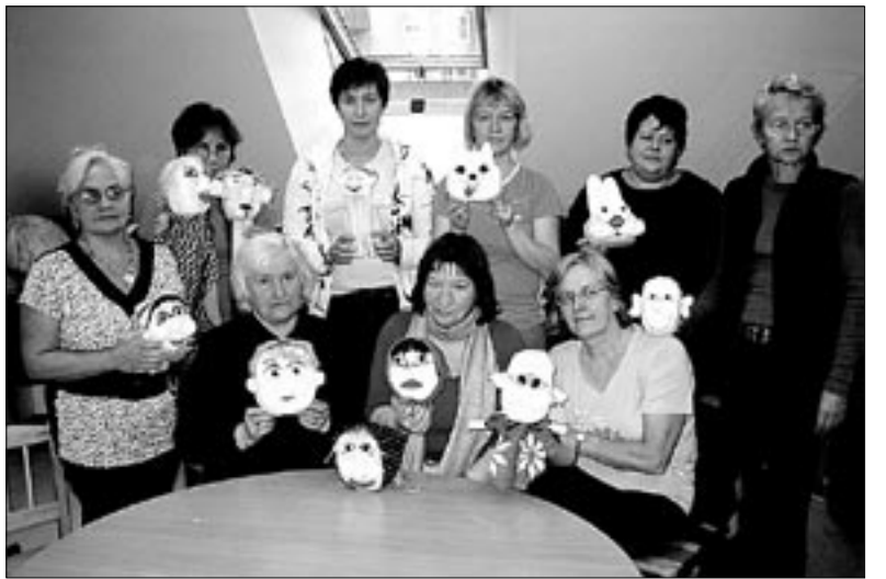
• Lasteaednikest käpiknukkude valmistajad oma loominguga.