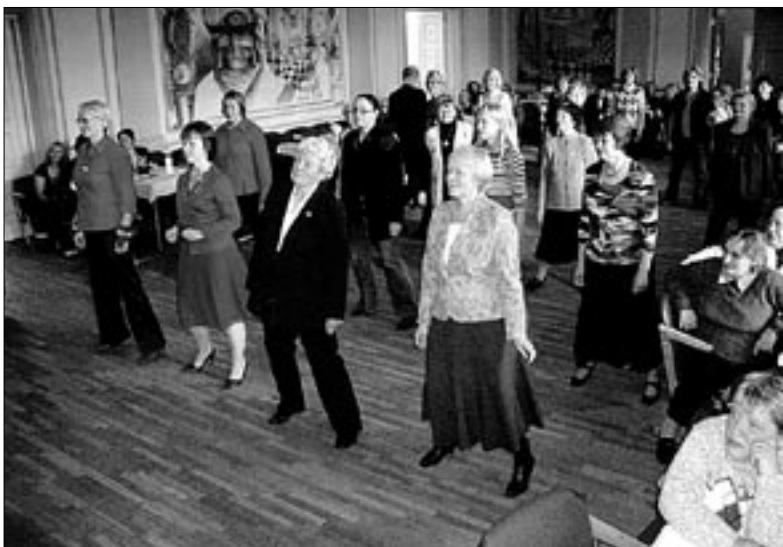
• Traditsioone hoidvad maanaised tahavad ka ajaga kaasas käia. Kokusaamisel Abjas olid nad varmselt nõus tänapäevast line-tantsu õppima.