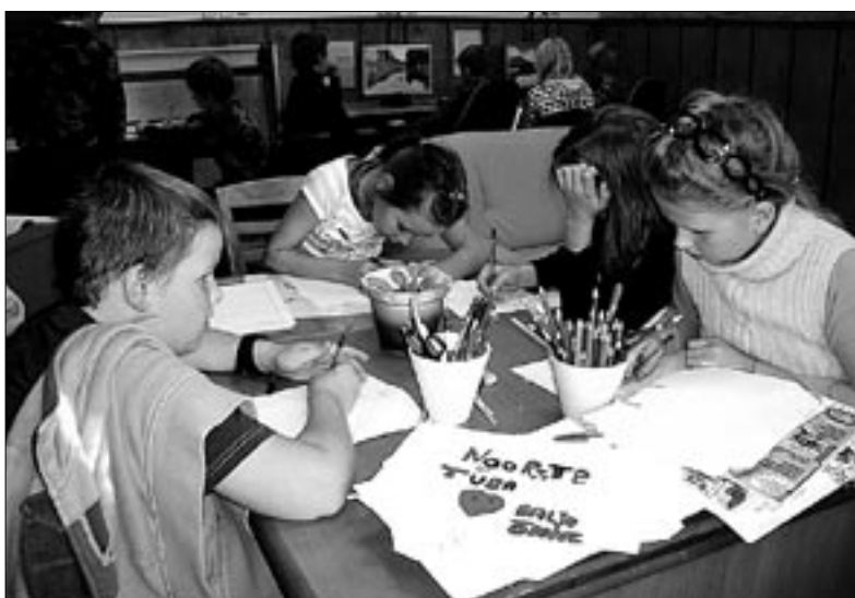
• Abja noortetoa sünnipäeva puhul joonistasid poisid-tüdrukud seal ka toredaid päevakohaseid õnnitluskaarte.