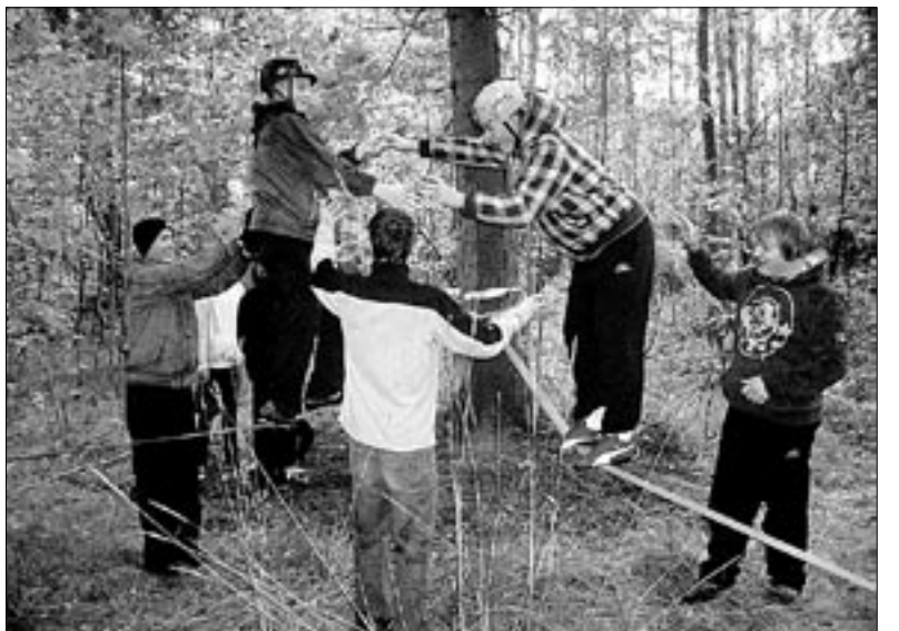
• Tervispäevaga ühendatud noorte eluspäeval Mõisakülas pakkusid kohalikele noortele erinevate kõieradade läbimisel metsas konkurentsi eakaaslased Karksi-Nuiast.