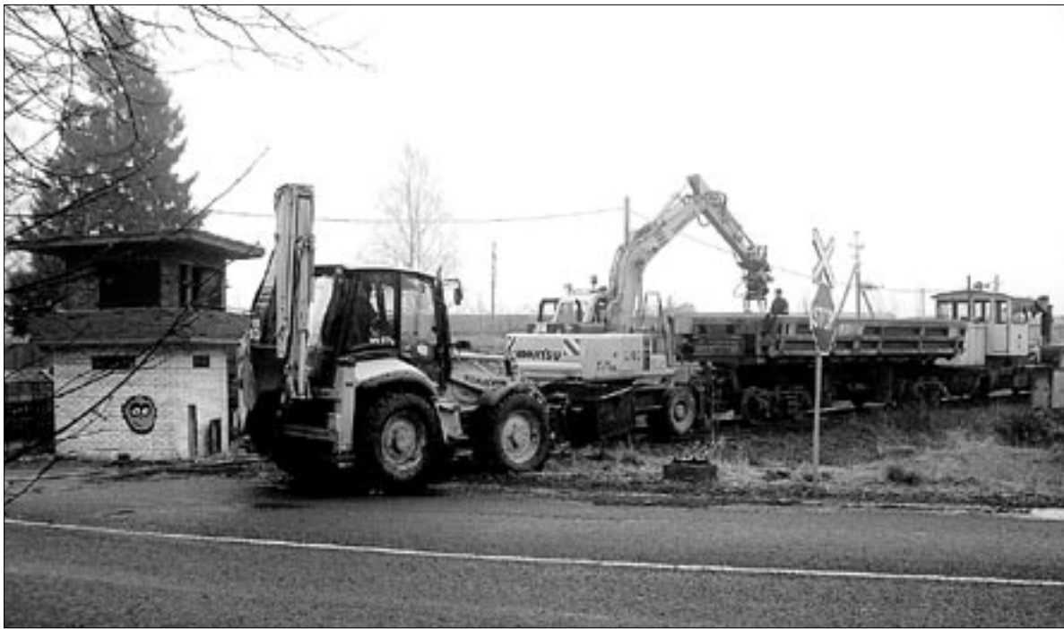
● Mõisaküla lähiajaloo üks märkimisväärseid tähtsaid on 23. jaanuar 2008, mil algas raudtee ülesvõtmine lõigul Mõisaküla-Pärnu.