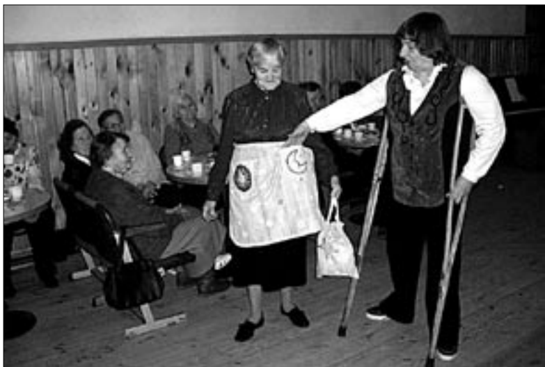
● Puudeinimeste ühenduse novembrikuisel koosviibimisel Mõisakülas esitlesid sealsed käsitöömeistrid kauneid omatehtud põllesid ja käsitöökotte.