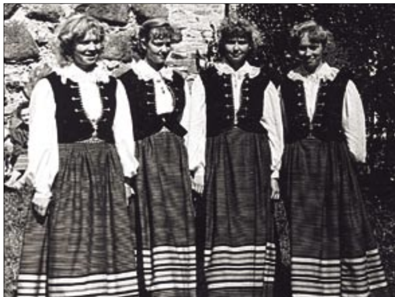
● Abja kultuurimajas 1950-ndatel aastatel tegutsenud topelt-duett Karksi lossimägedes.