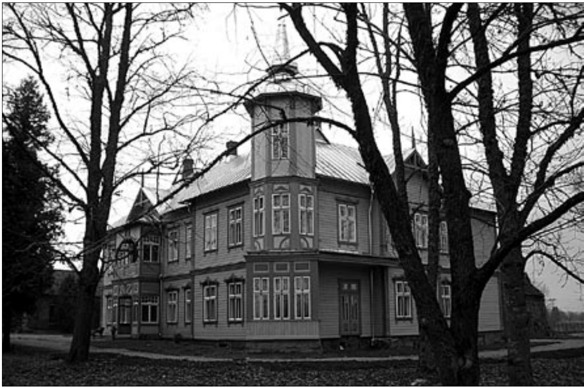
● Sajandivanuses omaaegse Puka talu taastatud häärberis Hallistes avati uue eakatekodu esimene järk, mis on valmis pakkuma eluaset kahekümne kuuetele vanurile.