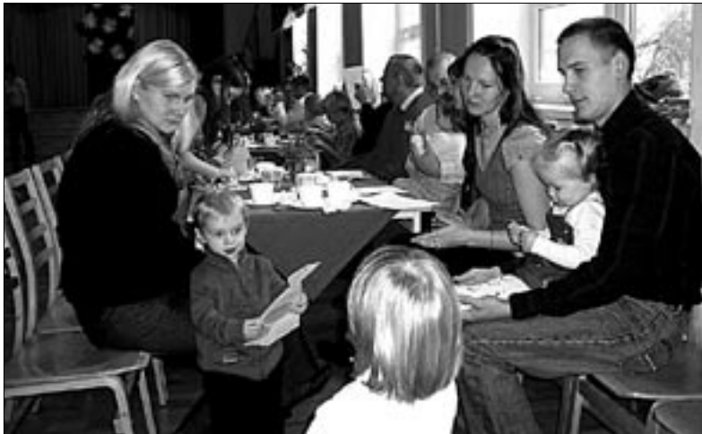
● Abja Gümnaasiumi ruumes toimus isadepäeval vaheldusrikka kavaga osavõturohke perepidu.