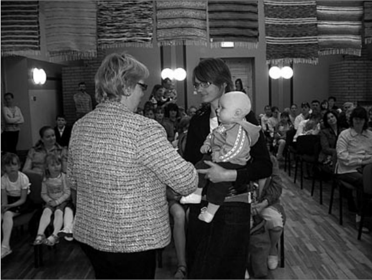
● Emadepäevapeol Halliste rahvamajas anti möödunud aastal vallas emakssaanutele üle väärtuslik lapsele mõeldud esimene raamat.