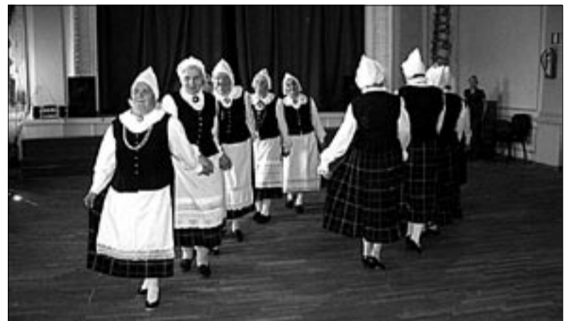
● Meelespea klubi tantsurühm tantsupäeval.