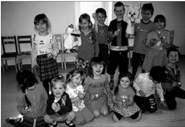
● Munadepüha tähistati Halliste lasteaias meeleolukalt.