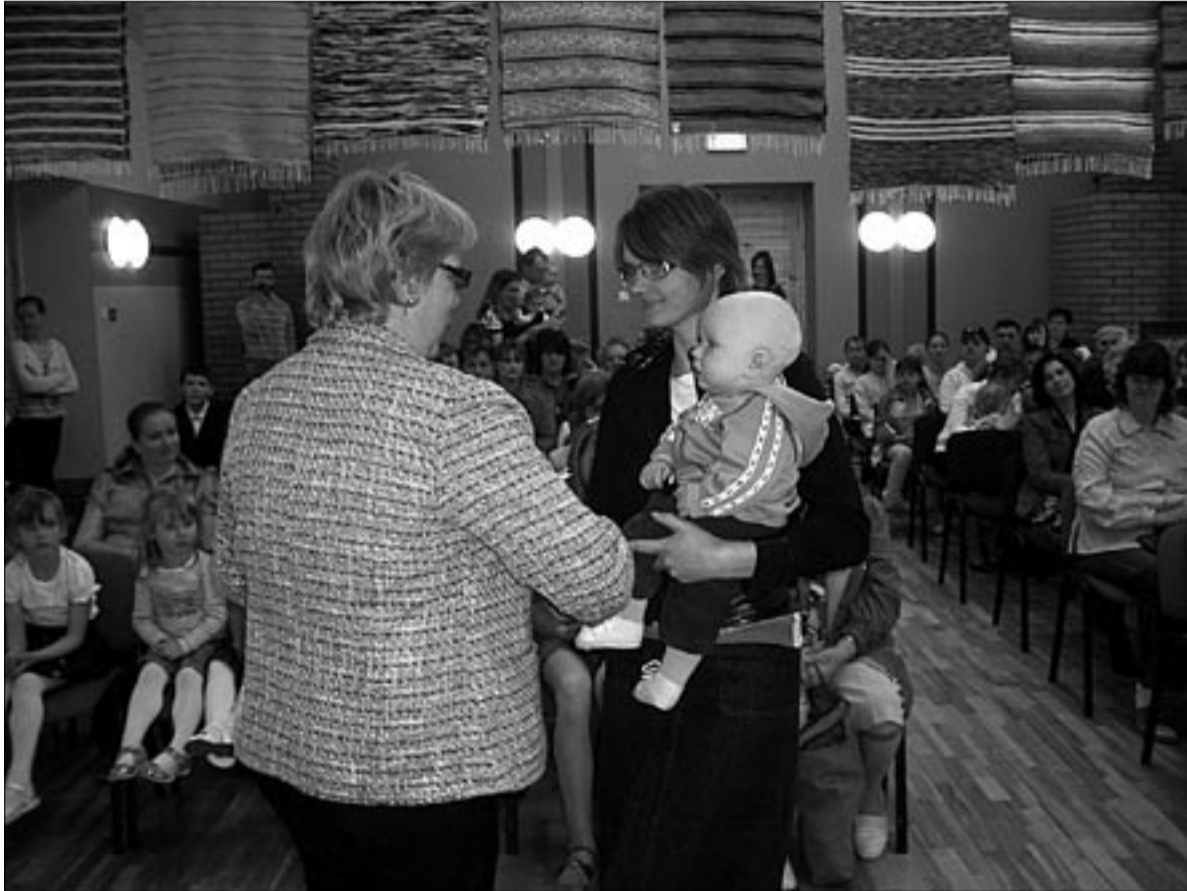
● Emadepäevapeol Halliste rahvamajas anti möödunud aastal vallas emakssaanutele üle väärtuslik lapsele mõeldud esimene raamat.