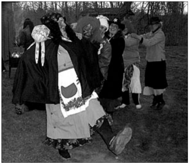
• Üks koht, kus volbriõõ nõiasabatil pöörast tantsu vihuti, oli ajaloolise Sarja vesiveski talu hoov.