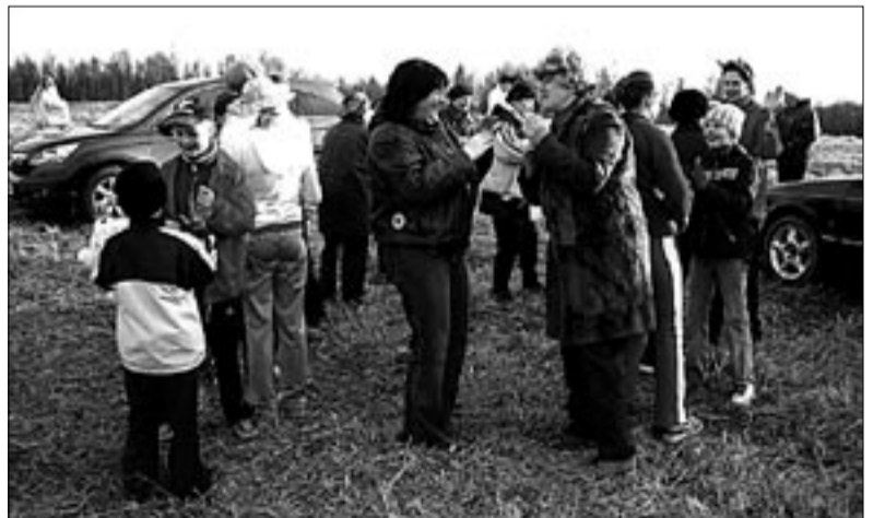
● Linnamäe jalamil.