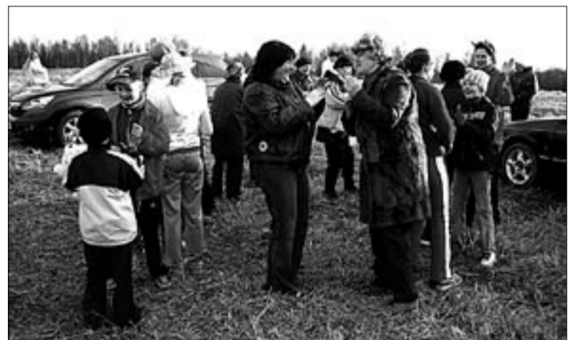
● Linnamäe jalamil.