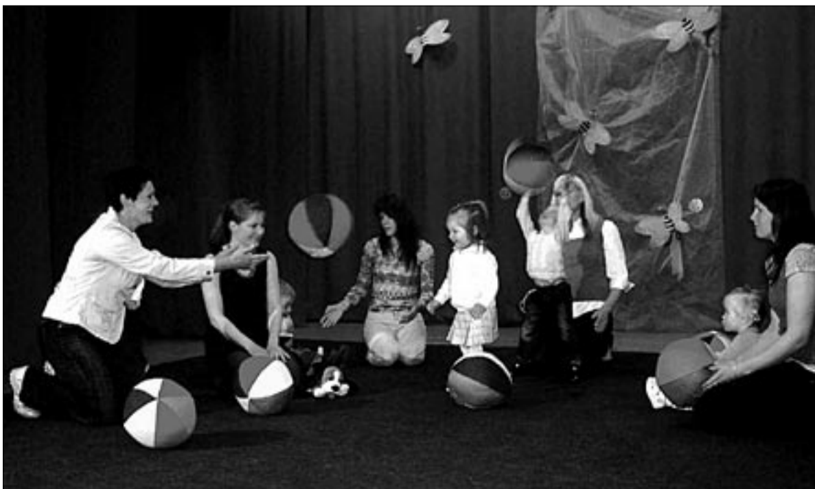
● Hetk emadepäevapeolt Abja kultuurimajas.