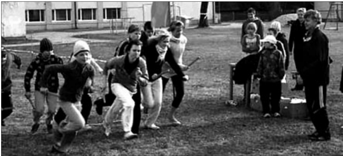
• Jüripäeva jooksul Mõisakülas startis kokku tosin õpilasvõistkonda.